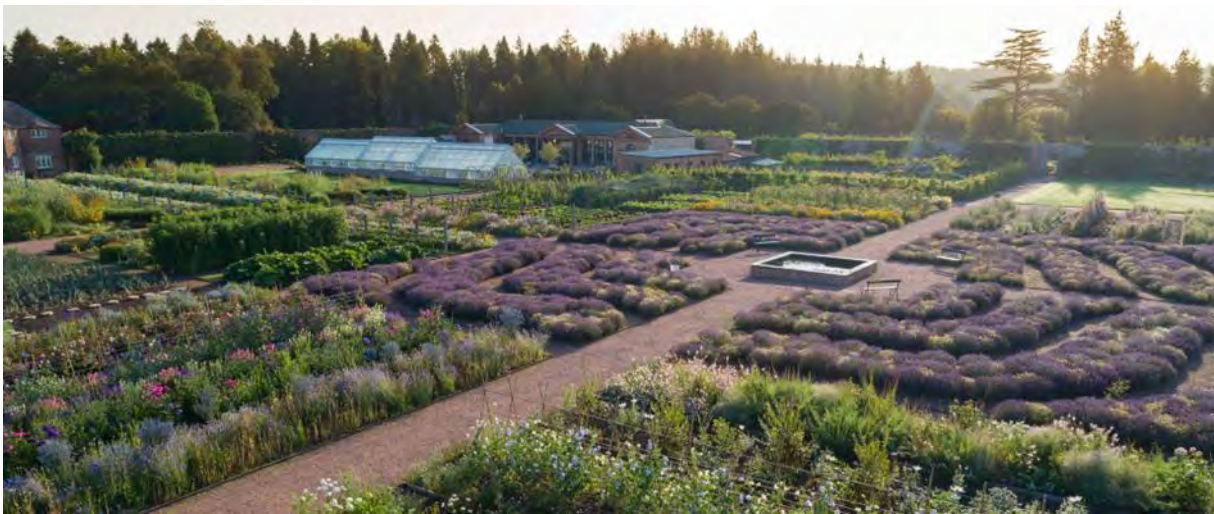
Le potager du château de Gordon

Vous recevez cet e-mail parce que vous avez participé à l'une de nos conférences (en ligne). Notre adresse postale est la suivante : contact@potagershistoriqueshistorickitchengardens.eu Copyright © 2025 European symposium on the conservation of historic fruit and kitchen gardens. Tous droits réservés.