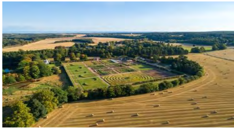
Le potager du jardin de Gordon Castle