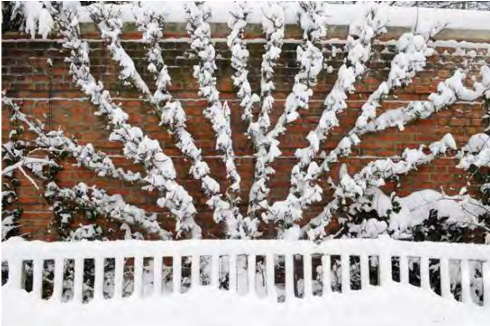
Espalier au jardin botanique de Chicago