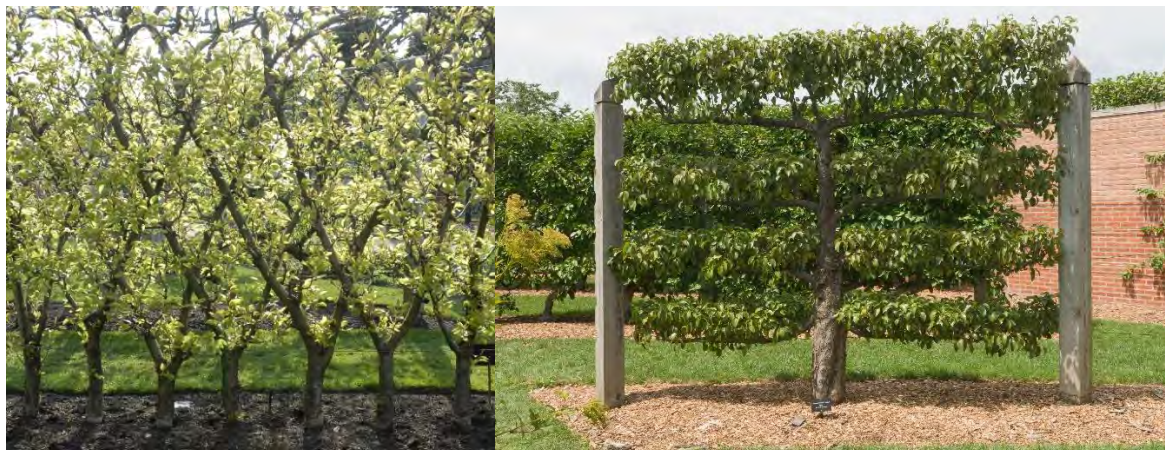
Arbres d'espalier au jardin botanique de Chicago