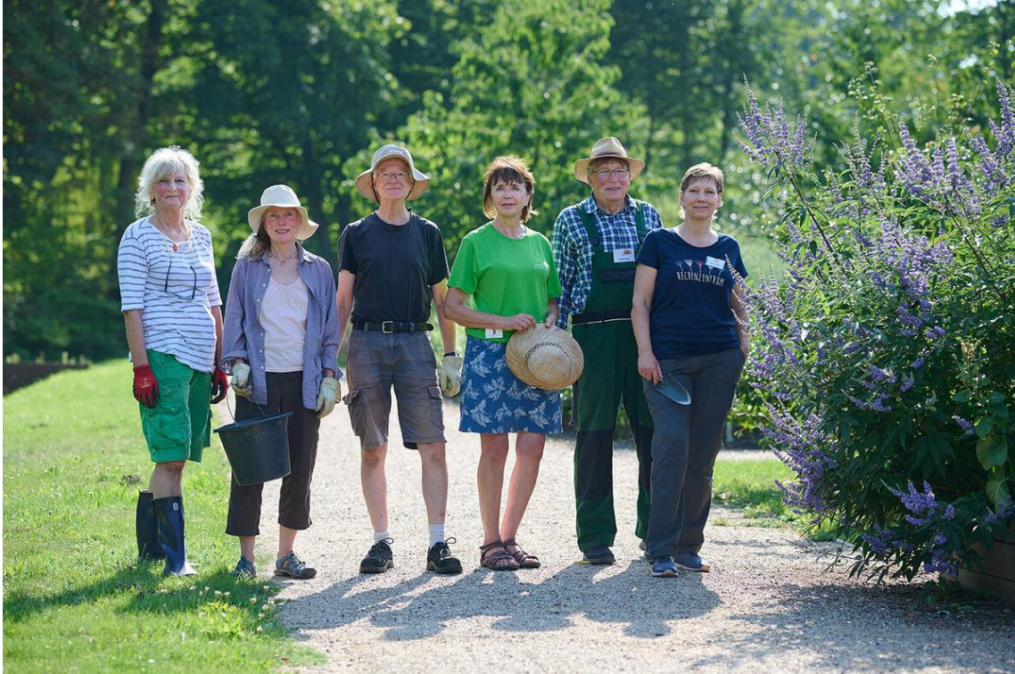
Bénévoles au Château d' Eutin