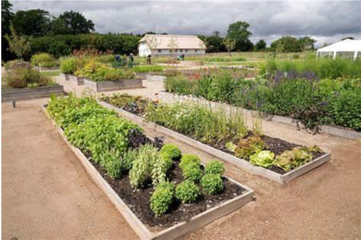
The Potager Royal du Château de Graasten, ©Claus Fisker, Ritzau Scanpix