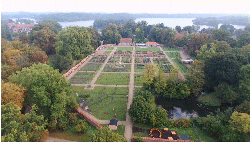
Le Potager du Château d' Eutin Castle, Allemagne