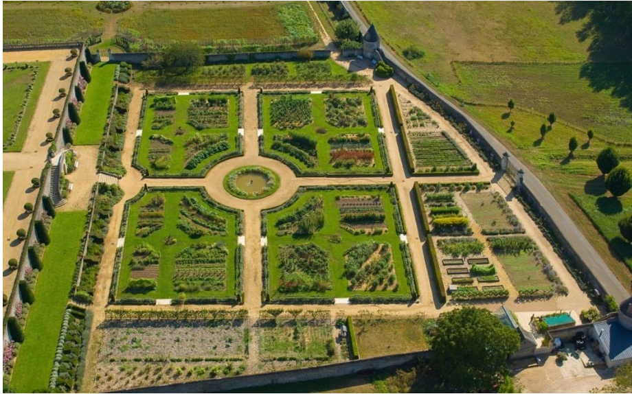
Château de Valmer

https://www.fondation-signature.org/prix-art-du-jardin-2023