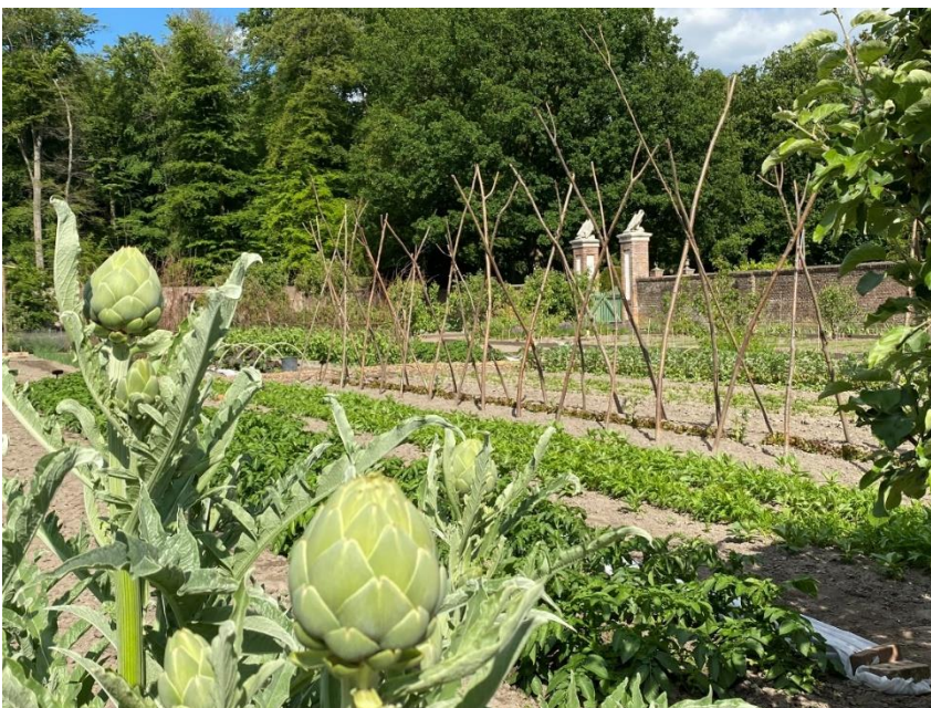
Le potager du Zuylestein, Leersum

Après Chambord, le deuxième Colloque européen sur la conservation des jardins fruitiers et potagers historiques aura lieu aux Pays-Bas les jeudi 5 et vendredi 6 septembre 2024. Lors de la webinaire du 8 juin, nous vous en dirons plus sur ce nouvel événement !